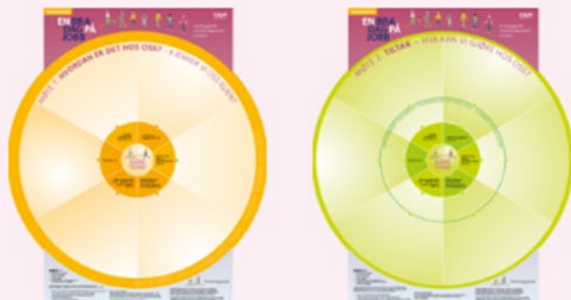
Guide for prosessansvarlige (pdf)

Forberedelse: Se filmene som er laget spesielt med tanke på å jobbe med arbeidsmiljø i barnehage. Ta notater!