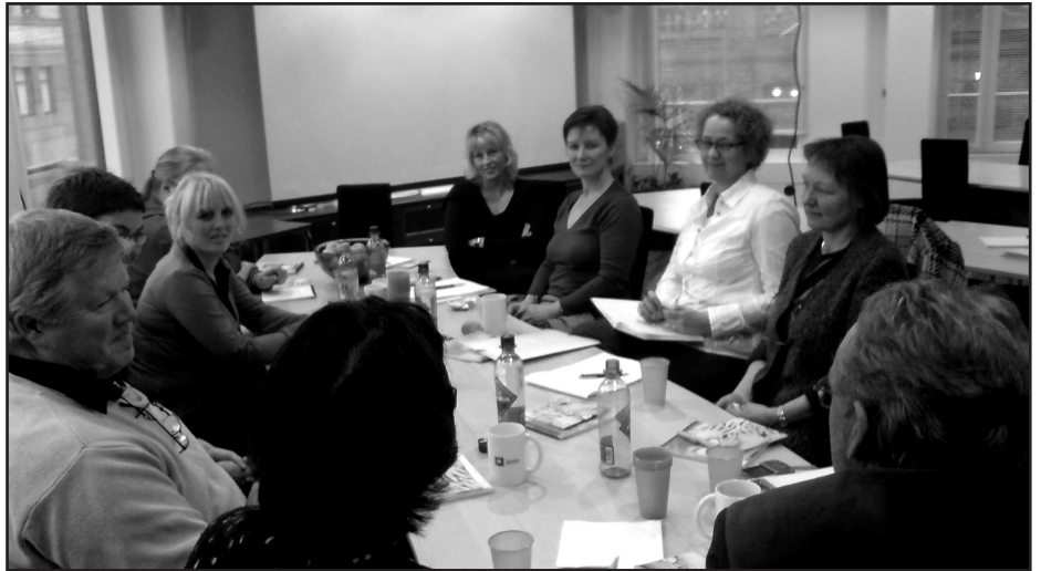
Tillitsvalde i Unio sine medlemsforbund og representantar frå den sentrale arbeidsgruppa møttest i Unio sine lokale etter oppstartskonferansen for Kvalitetskommunane.