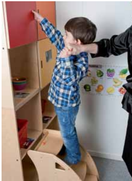
Deretter; finn alternativer til å løfte dersom barna ikke klarer seg selv, taburetter å stå på slik at du ikke må bøye deg.