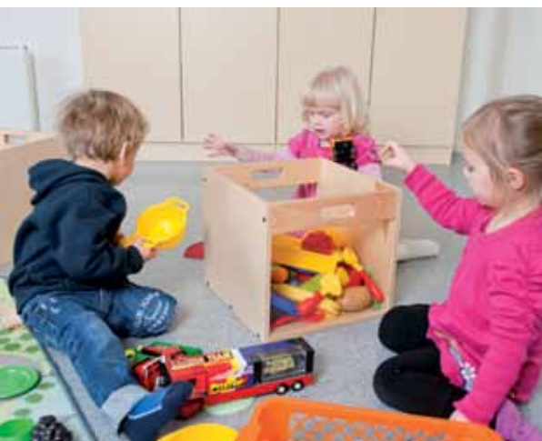
Liten, men ikke hjelpeløs. Klart vi kan rydde og hjelpe til.