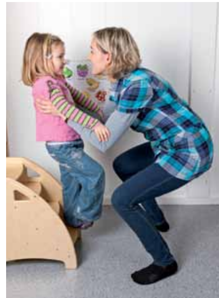
Og til slutt; Løft riktig. Hold ryggen rett, unngå vridninger, bruk muskler i bena i stedet for ryggen.

Stolen vil da ikke lage lyd når den blir skjøvet på. Et annet tiltak kan være å foreta støymåling ved å sette opp et lydøre som viser rødt når lyden blir for høy. Barna må gjøres bevisst på dette slik at de vet at de må dempe seg når øret lyser.