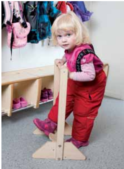
Først; La barna bruke egne ressurser, bruke hjelpemidler osv.